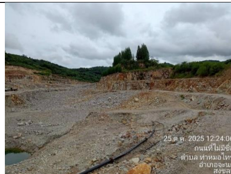
รูป 2 หน้าเหมืองปัจจุบัน