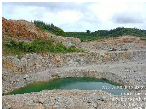
รูป 3 Sump ในบ่อเหมือง