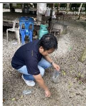
รูป 20 เก็บตัวอย่างเปลือกดินเศษหินในพื้นที่โครงการ