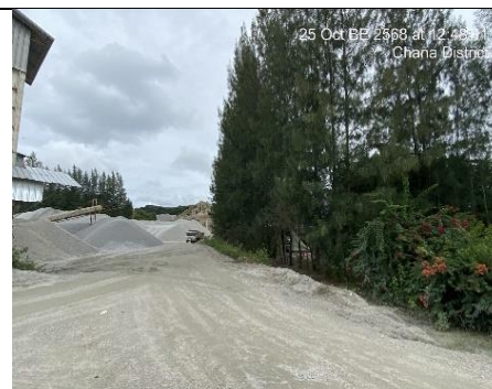
รูป 6 แนวต้นไม้รอบบริเวณโรงแต่งแร่