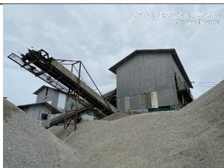
รูป 17 การติดตั้งอุปกรณ์ปิดคลุมโดยตลอดพร้อมทั้งติดตั้งเครื่องฉีดสเปรย์น้ำ