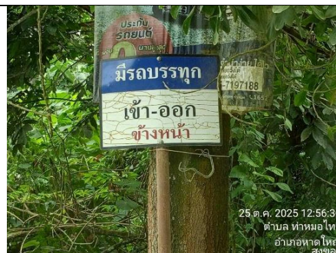
รูป 22 ป้ายเตือนให้ระวังรถบรรทุก