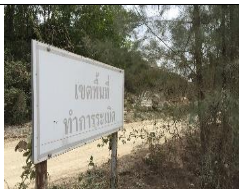
รูป 36 ติดป้ายเตือนเขตการใช้วัตถุระเบิด