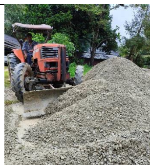
รูป 24 ส่วนร่วมในการพัฒนาท้องถิ่นและช่วยเหลือกิจกรรมของชุมชนการสร้างถนนลาดยางในบริเวณเส้นทางขนส่งแร่