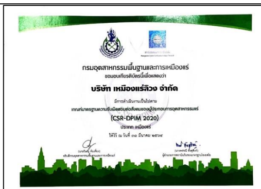
รูป 31 เข้าร่วมโครงการ CSR-DPIM