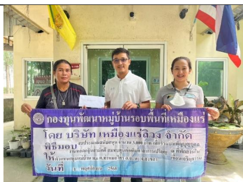
รูป 39 โครงการช่วยเหลือชุมชน