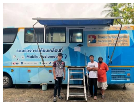
รูป 40 โครงการช่วยเหลือชุมชนจากกองทุนเฟ้าระวัง สุขภาพและตรวจสุขภาพ