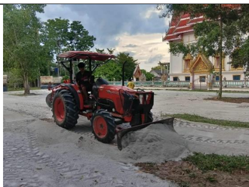
รูป 37 โครงการช่วยเหลือชุมชน