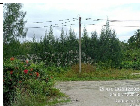
รูป 14 การปลูกพืชคลุมดินและและไม้ยืนต้น