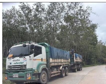
รูป 12 ถนนภายนอกโครงการที่มีการลาดยางและการปิดคลุมผ้าใบบรรทุกทุก