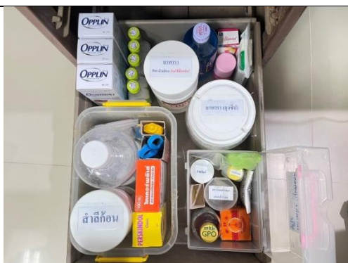
รูป 27 เครื่องมือปฐมพยาบาล ยาสามัญประจำบ้าน เวชภัณฑ์ที่จำเป็น