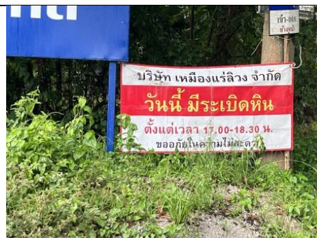
รูป 34 กำหนดให้ทำการระเบิดแร่วันละ 1 ครั้ง ในช่วงเวลา 16.00-17.00 น.