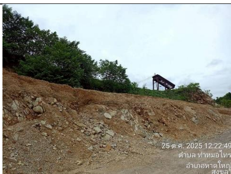
รูป 7 แนวต้นไม้รอบบริเวณหน้าเหมืองและการฟื้นฟูพื้นที่ที่ไม่ทำเหมืองแล้ว