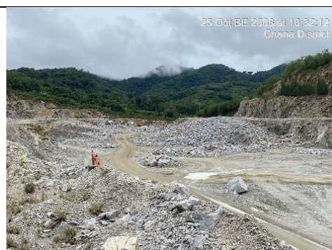
รูป 8 ที่เก็บกองเปลือกดิน