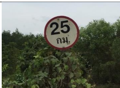
รูป 21 จัดทำป้ายสัญญาณเตือนความเร็วไม่เกิน 25 กิโลเมตร/ชั่วโมง