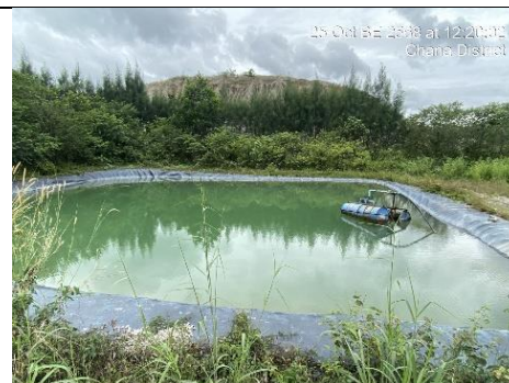
รูป 4 บ่อดักตะกอน “บ”