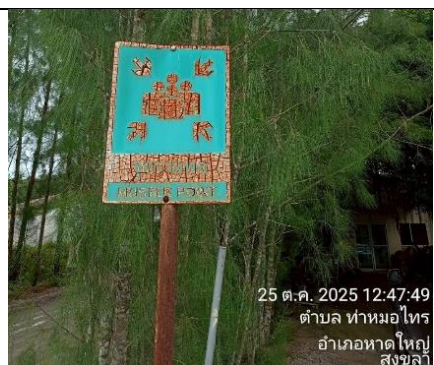
รูป 19 กำหนดจุดรวมพล หรือวางแผนอพยพ