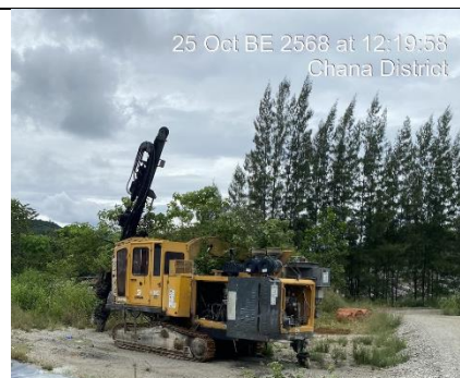
รูป 32 การเจาะรูระเบิดจะต้องติดตั้งเครื่องมืออุดฝุ่นที่ บริเวณหัวเจาะ