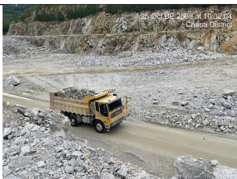
รูป 11 ถนนภายในโครงการ