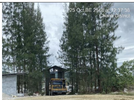
รูป 9 การปิดคลุมปากไม่แรกและรบรรทุกหิน