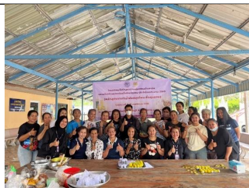
รูป 38 โครงการช่วยเหลือชุมชน