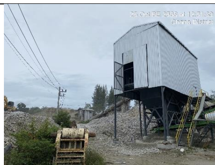
รูป 10 การปิดคลุมตะแกรงคัดขนาด