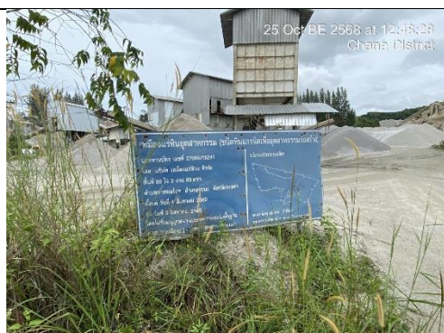
รูป 15 จัดทำป้ายแสดงขอบเขตพื้นที่โครงการ