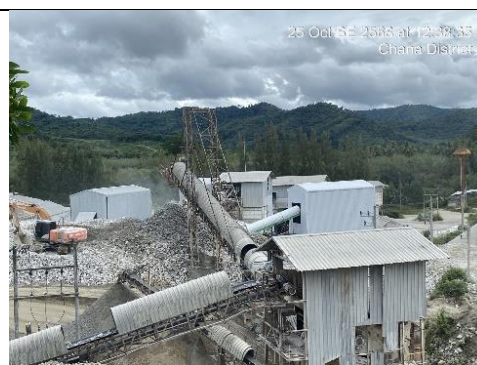
รูป 16 การปิดคลุม เครื่องบดชุดที่ 1 และ 2 และชุดตะแกรง