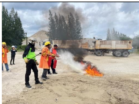
รูป 29 ปฏิบัติตามวิธีการให้ความคุ้มครองแก่พนักงาน และ อบรมความปลอดภัย