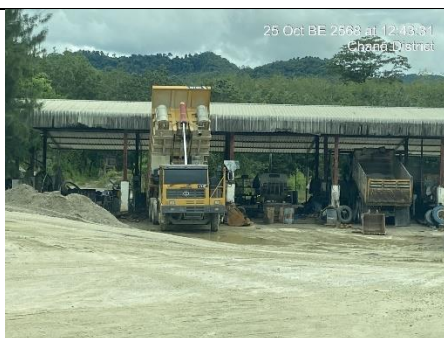
รูป 35 ได้ล้างทำความสะอาดบรรทุกแร่บ้างเป็นระยะๆ