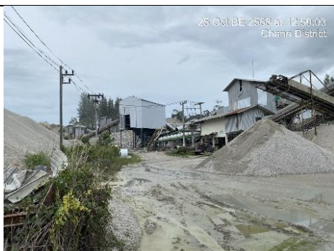
รูป 5 คุระบายน้ำบริเวณโรงแต่งแร่