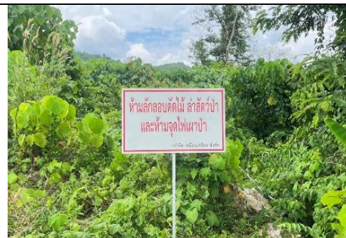
รูป 30 ป้ายเตือนห้ามลักลอบตัดไม้ ล่าสัตว์ป่า และห้ามจุด ไฟเผาป่า