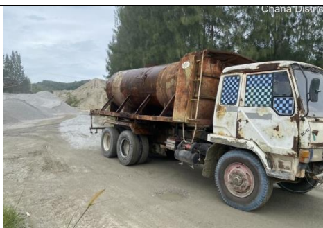
รูป 33 มีการฉีดพรมน้ำบริเวณหน้าเหมืองของโครงการ