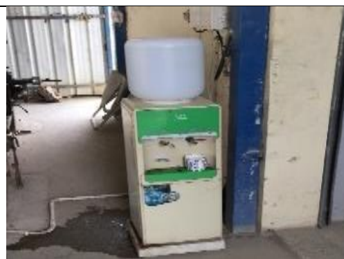
รูป 28 ได้ให้น้ำดื่ม น้ำใช้ ที่พักอาศัย