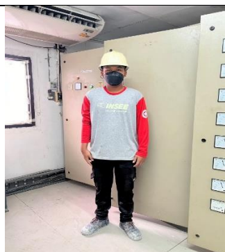
รูป 26 ได้จัดเตรียมอุปกรณ์ป้องกันอันตรายส่วนบุคคลที่เหมาะสมให้แก่พนักงาน