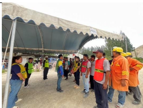
รูป 23 โครงการได้พิจารณาจ้างแรงงานในท้องถิ่นก่อนเป็นลำดับแรก