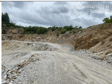
รูป 1 หน้าเหมืองปัจจุบันที่เป็นชั้นบันไดและเส้นทางลำเลียง