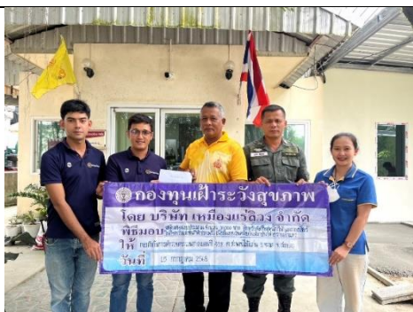
รูป 25 โครงการจัดตั้ง “กองทุนเฝ้าระวังสุขภาพ”